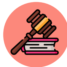
ยุทธศาสตร์ที่ 3

ขับเคลื่อนและผลักดัน มาตรการทางกฎหมาย สังคม และสวัสดิการ