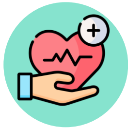
ยุทธศาสตร์ที่ 1

ส่งเสริมและป้องกัน ปัญหาสุขภาพจิต ตลอดช่วงชีวิต